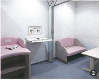
① 幼児室 ② 授乳室